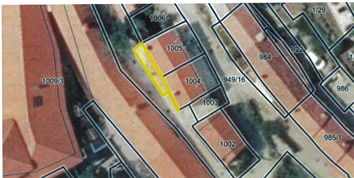
parc. št. 949/17 k.o. Štanjel

Z ukinitvijo javnega dobra bodo nastopili pogoji za razpolaganje z nepremičninama. Priloženi sklep o ukinitvi grajenega javnega dobra zato predajamo v obravnavo, s predlogom, da se ga sprejme.