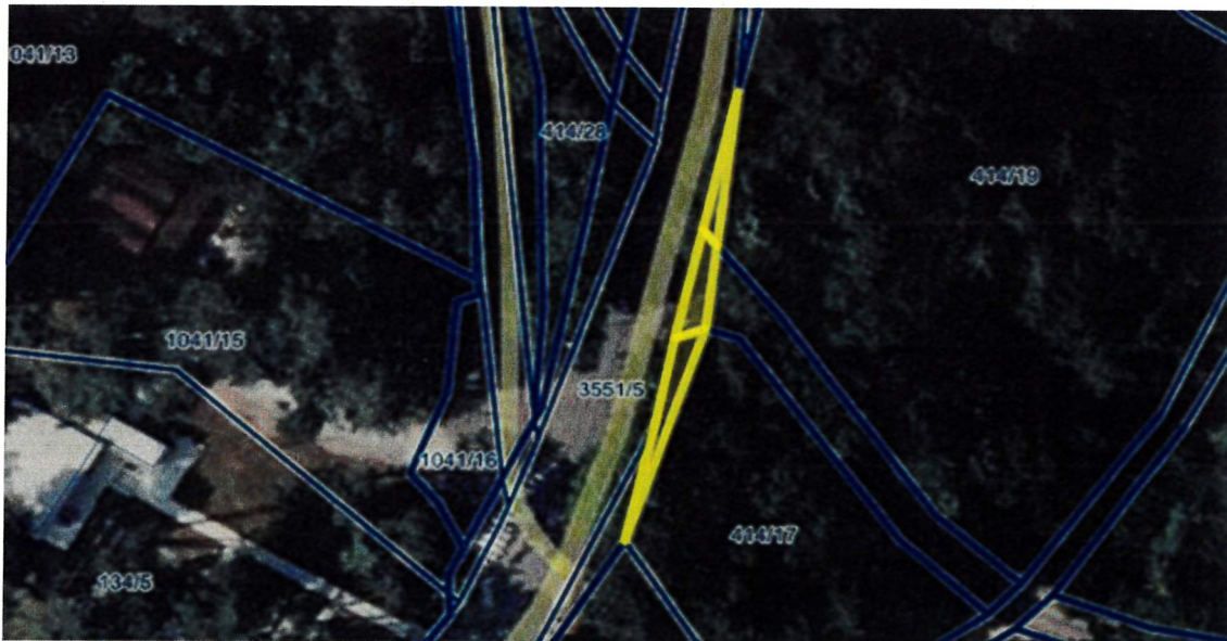
parc. št. 3551/23, 3551/27 in 3551/28 vse k.o. Komen