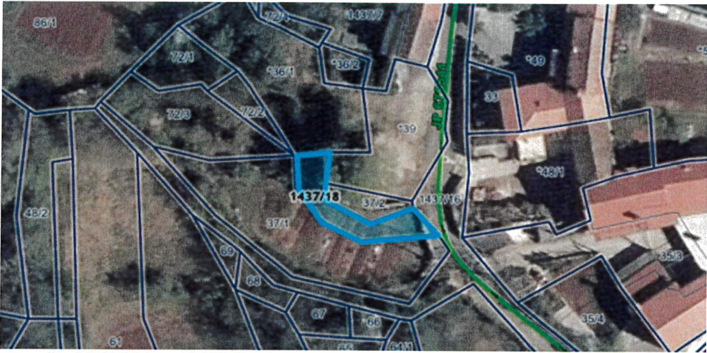
parc. št. 1437/18 k.o. Volčji Grad