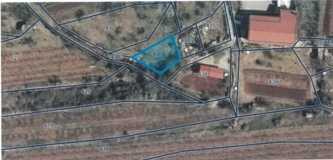
parc. št. 430 k.o. Volčji Grad