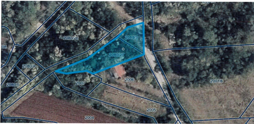
parc. št. 2080/3 in 2080/27 k.o. Kobjeglava