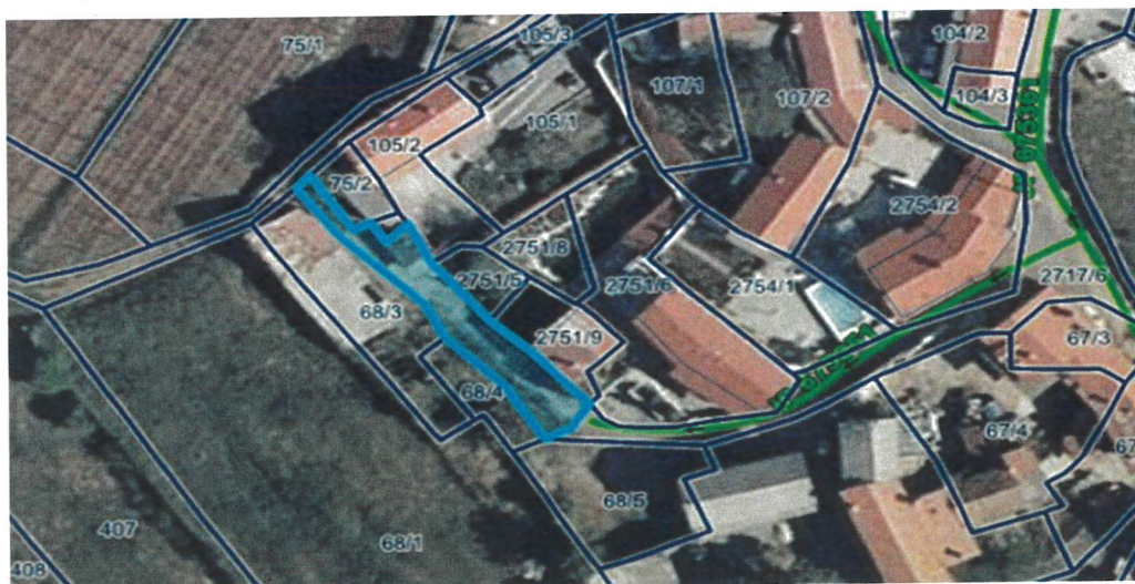
parc. št. 2717/7 k.o. Kobjeglava

Z ukinitvijo javnega dobra bodo nastopili pogoji za razpolaganje z nepremičninama. Priloženi sklep o ukinitvi grajenega javnega dobra zato predajamo v obravnavo, s predlogom, da se ga sprejme.